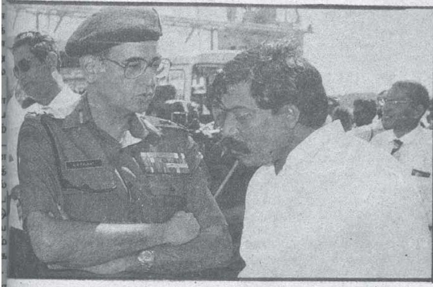
துருக்கி பெருமான், 'அமைதி'ப்படை தளபதி கல்கத்துடன் சதி ஆலோசனை.

10 டிவிசன் படைகளும் ஆயுதங்களும் இலங்கைப் போரில் குவிக்கப்பட்டன. அதாவது 30% சிறப்பு படைப் பிரிவுகளும் உலகின் 4வது பெரிய படையின் 10% மனித சக்தியும் இலங்கையின் வடக்கு - கிழக்கு மாகாணங்களில் குவிக்கப்பட்டன. பம்பாயிலிருந்து வெளிவரும் "எக்ஸாமிக் அண்ட் பொலிடிகல் வீக்லி" மார்ச் '89 இதழில்,