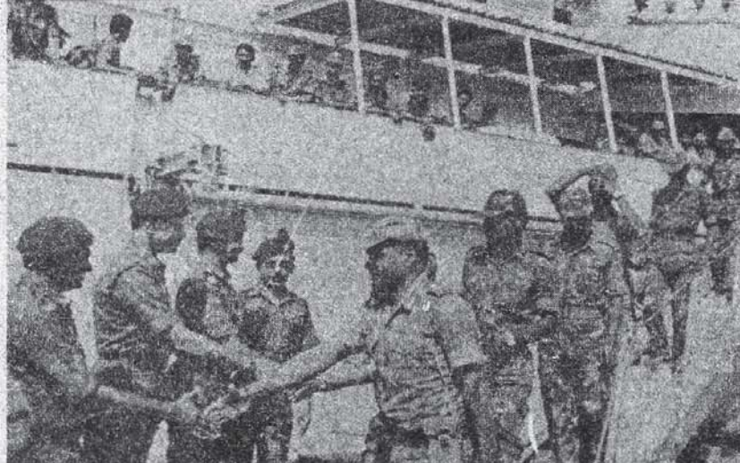
தோற்றுப் போன சகித்திட்டம்: 'அமைதிப்படை' வாபஸ்

னாய்வு மூலம் திரட்டிய ரகசியச் செய்திகளை கேட்டு வாங்கினர். இவர்கள் வெறும் போலீஸ்காரர்கள் தான் என்பதால் போராளிகளின் - குறிப்பாக பயிற்சியும், செயலாக்கமும் நிறைந்த புலிகளின் - ராணுவ வல்லமையை மதிப்பிடத் தெரியவில்லை.