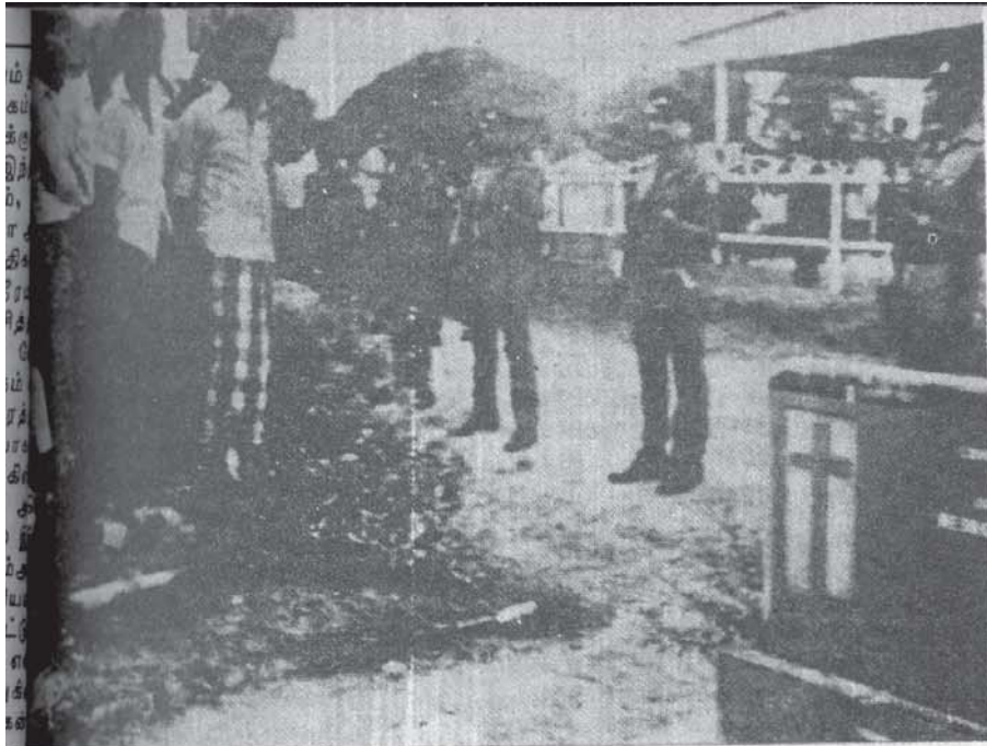
இன்னொரு மேல்நிலை வல்லரசு என ருஷ்யாவோ முந்திக்கொண்டு வந்து பாசிச ராஜீவ் கும்பலின் விஸ்தரிப்பு மற்றும் ஆக்கிரமிப்புக்கொள்வகளை ஆதரித்தது. வங்கதேசப் போருக்கு முன்பு போடப்பட்ட இந்திய-ருஷ்யா இராணுவ ஒப்பந்தமே இந்தியாவின் பிராந்திய மேலாதிக்கத்தை அங்கீகரிப்பதுதான். இரு வல்லரசுகள் தவிர பிற மேற்கு ஏகாதிபத்தியங்களின் கூட்டமைப்பான ஐரோப்பியப் பொருளாதார சமூகமும் இந்தியாவின் நடவடிக்கைகளை ஏற்றுக் கொண்டுள்ளது.

இந்தியா, இலங்கை போன்ற பின்நங்கிய மூன்றாம் உலகநாடுகள் மீது மேலாதிக்கம் வகிக்கவும், கொள்ளையிடவும், செல்வாக்கு மண்டலங்களாகப் பகிர்ந்து கொள்ளவும் அமெரிக்கா மற்றும் ருஷ்ய மேல்நிலை வல்லரசுகளுக்கிடையே கடுமீ போட்டி நிலவுவது உண்மையே. அதேசமயம் இந்தநாடுகளின் விடுதலைப் போர்களையும் சமூகப் புரட்சிகளையும் அடக்கி ஒடுக்குவதில் அவர்கள் கூட்டுச் சேர்ந்திருப்பதும் உண்மையே. விடுதலைப் போர்களும், புரட்சிகளும் வெடிப்பதைத்தான் “ஸ்திரத் தன்மையைக் குலைப்பதாக” அவர்கள் கருதுகிறார்கள். அவற்றை ஒடுக்குவதைத்தான் “ஸ்திரத் தன்மையைக் காப்பதாக” கருதுகிறார்கள்.