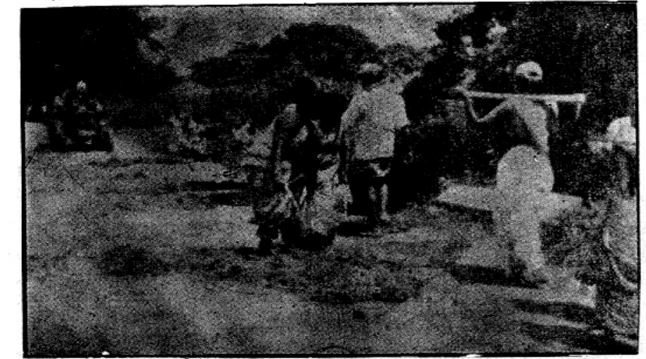
ஓயாத அலைகள் - 03 பெருஞ்சமர் : விதி செப்பனிடும் மகன்