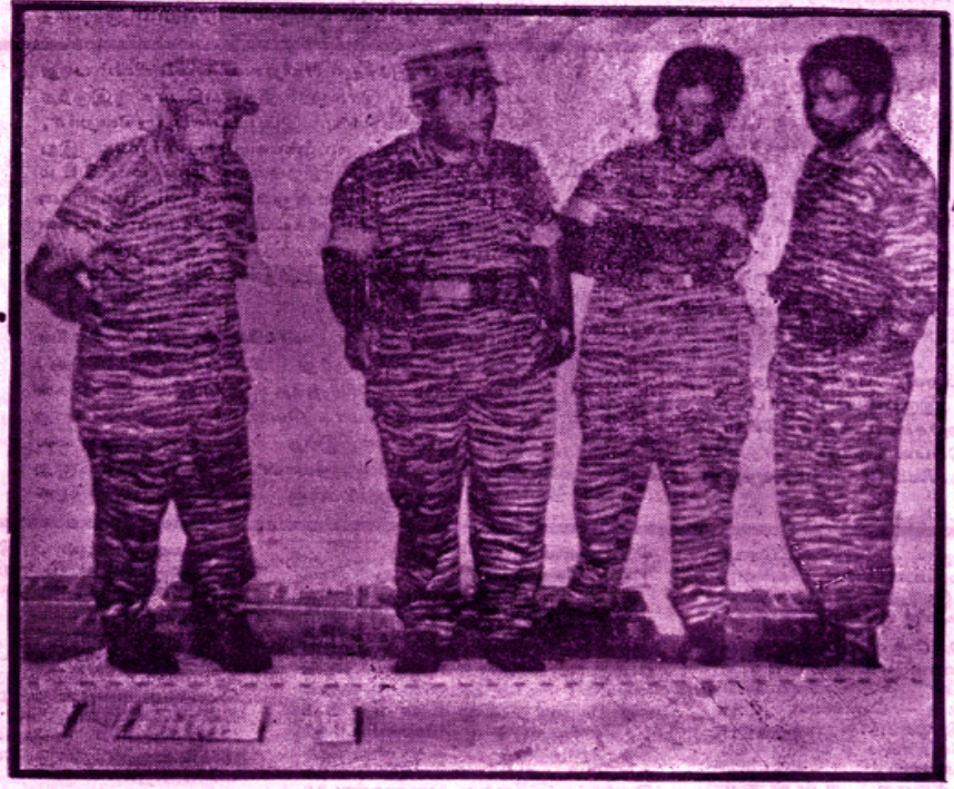
விழாது எனஆறு வேரோடிதின்ற பனவிடு - கூர்மீளிகும் தலைவன் போர்வாளில் வீழ்ந்ததுகாண்! பாழாக்கி, பகைவாலும் யாழ்மன்னின் துயர்போக்க புலியணிகள் பாய்ந்தனகாண், தலைவன் படைநடத்த!

என்ற பேரினவாத நிலைப்பாட்டை சத்திரிகா அரசாங்கம் மாற்றியமைக்க முயலவில்லை. அரசுபொருளாதாரத்தின் கணிசமான பகுதியை போருக்குச் செலவிட்டு - இப்போது அதையும் போதாதென்று போர்க்கால நிலையைப் பிரகடனப்படுத்தி மேலும் பண ஒதுக்க (2 ம் பக்கம் பார்க்க) →