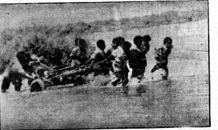
120 ஊர் பிரங்குகளை நேருடாக நகர்த்தும் புலிவீரர்கள்: கீட்டு பிரங்கிப் பணியினர்! சூட்டாதரவு, புலிவீரர்களுக்கு புதரத்தம் போன்றது!