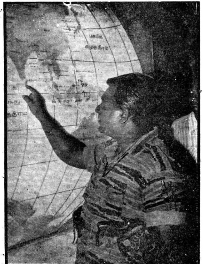
தமிழருக்கு ஒரு பதில்!

இதனால். அதாவது, ஈழத் தமிழர் சிங்கள - பெளத்தரால் இனம் மாற்றப்பட வேண்டும் (Policy of assimilation); அவ்வாறு இனம் மாறத் தவறினால், அவர்கள் அழித்தொழிக்கப்பட வேண்டும் என்பதாகும். சந்திரிகா கூறும் "சமாதானம்", "போர்" என்பவற்றின் அர்த்தம் என்னவெனில், முதலாவதன் விளக்கம், சரணடைந்து இனம் மாறு; இரண்டாவதன் விளக்கம், அப்படிச் சரணடைந்து இனம் மாறத் தவறினால் அழித்தொழித்தல் என்பது.