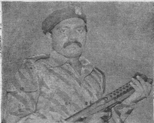
என்பதுகளில் தலைவர் பிரபாகரன்

ஒரு மாபெரும் விடுதலைச் சத்தியாக வளர்ந்து, இக்காலகட்டத்தின் முக்கிய வரலாற்று நிகழ்வுகளையும் திருப்புமுனைகளையும் புலி