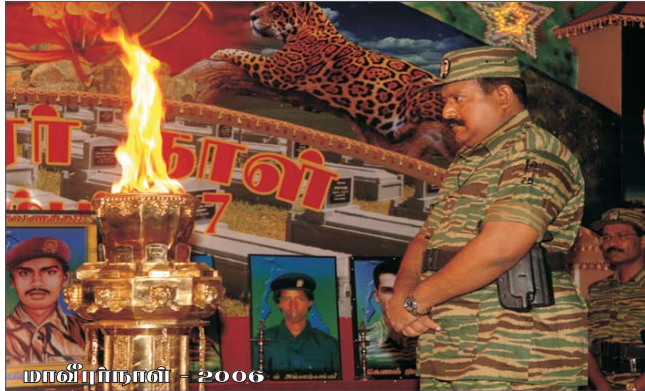
மாவீரர்நாள் - 2006

மகிந்த அரசு ஒருதலைப்பட்சமாகப் போர்நிறுத்தத்தை முறித்து, தமிழர் தாயகத்தின் புவியியல் ஒருமையப் பட்டையும் தனித்துவத்தையும் அழித்தொழிக்கும் இராணுவச் செயற்பாட்டை இன்று ஈவிரக்கமற்றச் செயற்படுத்தி வருகிறது. ஆயிரக்கணக்கில் எம்மக்களைக் கொன்று வித்து, கடத்திப் புகைகுழிகளுக்குட் புகைத்து, பெரும் மனித அவலத்தை எம்மண்ணில் நிகழ்த்திவருகிறது. அனுசரணையாளரான நோர்வேயை அட்டடி அடக்கிவருகிறது. கண்காணிப்புக்குமுடிவாகக் கார்ப்பமாக இயர்சித்துவருகிறது.