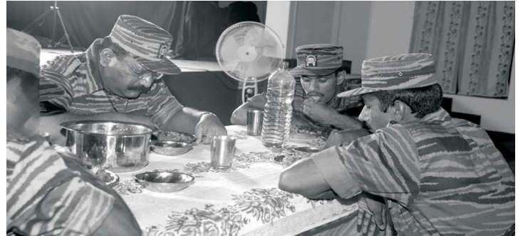
தேசியத் தலைவருடன் உணவுருந்தும் “நடவடிக்கை எல்லாள்” கரும்புலி வீரர்கள்