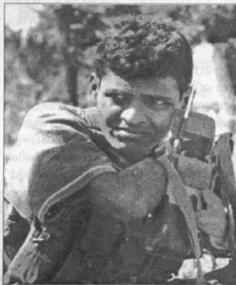
நகரணைக்கூட கைப்பற்ற முடியாமல் சிங்களப்படைகள் திணறிக்கொண்டிருந்தன.

ஜெயசிக்கு எதிரிச்சமர் வரலாற்றில் அந்த முப்பது நிமிடச் சண்டையும் முக்கிய இடத்தைப் பெற்றது. ஜெயசிக்குப் படைகள் 98 பெர்வரி 04க்குள் கண்டிவீதியைப் பிடித்து யாழ்ப்பாணத்தில் உள்ள சிங்களப் படைகளுக்கு காள் விநியோகத்தை ஏற்படுத்திவிடுவான் என்ற பதில் பாதுகாப்பு அமைச்சரின் காலக்கெடுவை ஏழு மாதங்கள் கடந்திருந்தன. மாங்குள