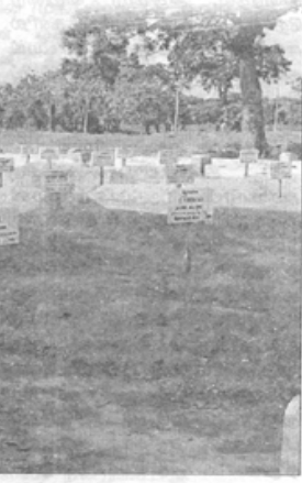
டாலும் முற்றுகையை உடையுங்கள்.